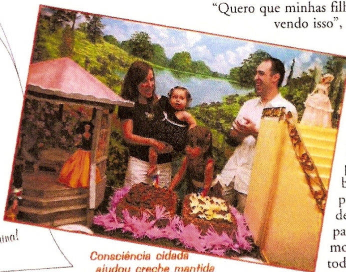
Consciência cidadã ajudou creche mantida pelo Projeto Viver.