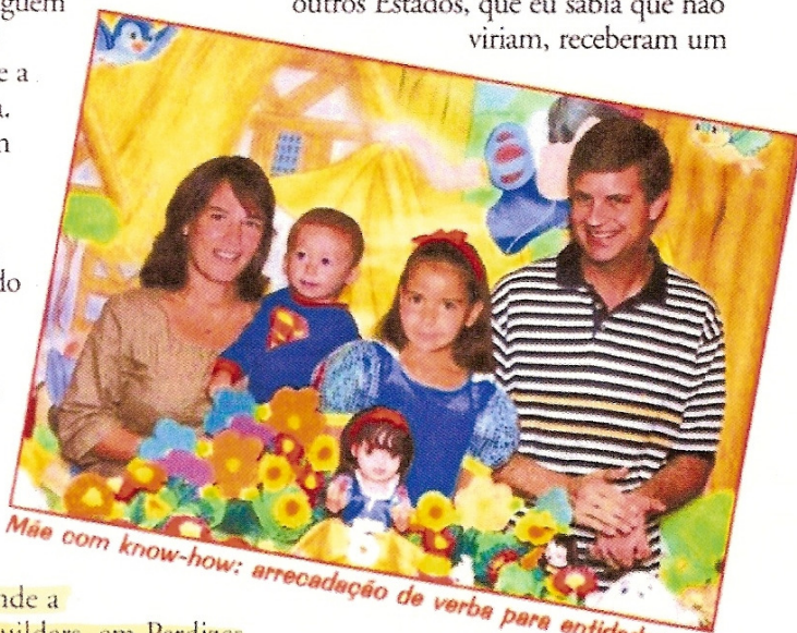
Mãe com know-how: arrecadação de verba para entidades.