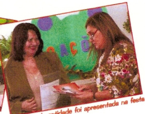
Proposta da entidade foi apresentada na festa.