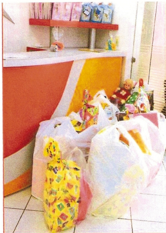
Ajuda ao próximo: tradição familiar.